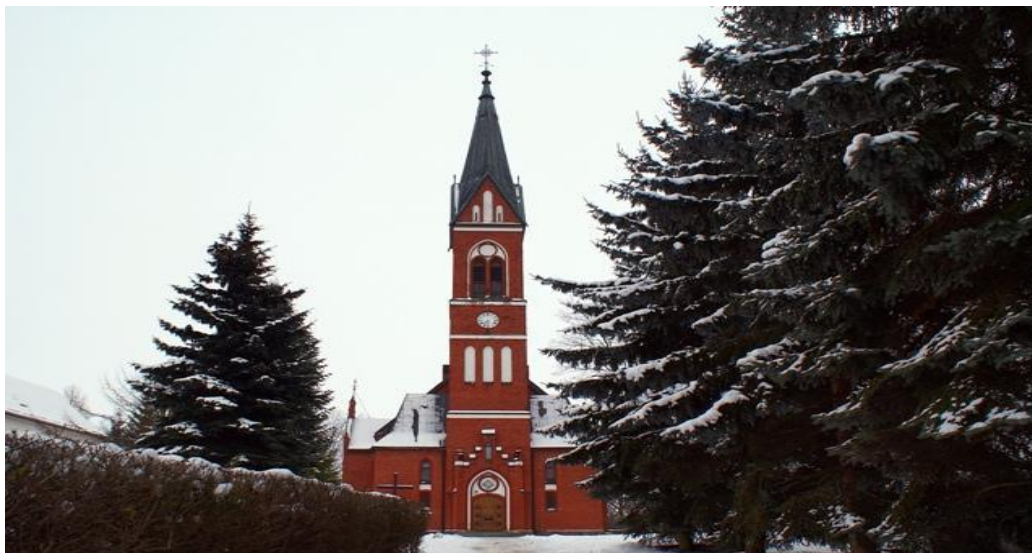
Zdjęcie: Kościół p.w. św. Stanisława Kostki w Karolewie