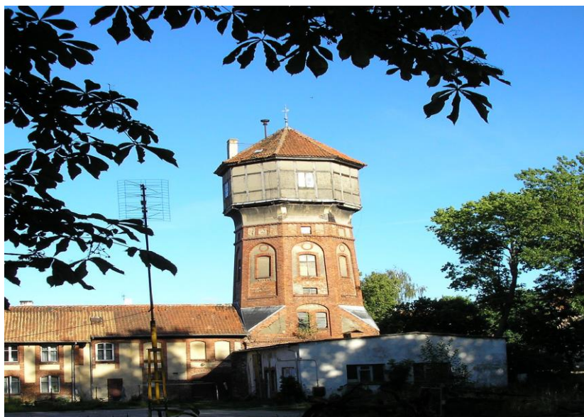
Zdjęcie /2013r/: Wieża Ciśnień w Karolewie. W chwili obecnej po remoncie przeprowadzonym w roku 2014.