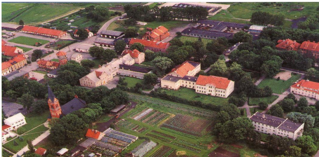
Zdjęcie: Widok miejscowości Karolewo z lotu ptaka.