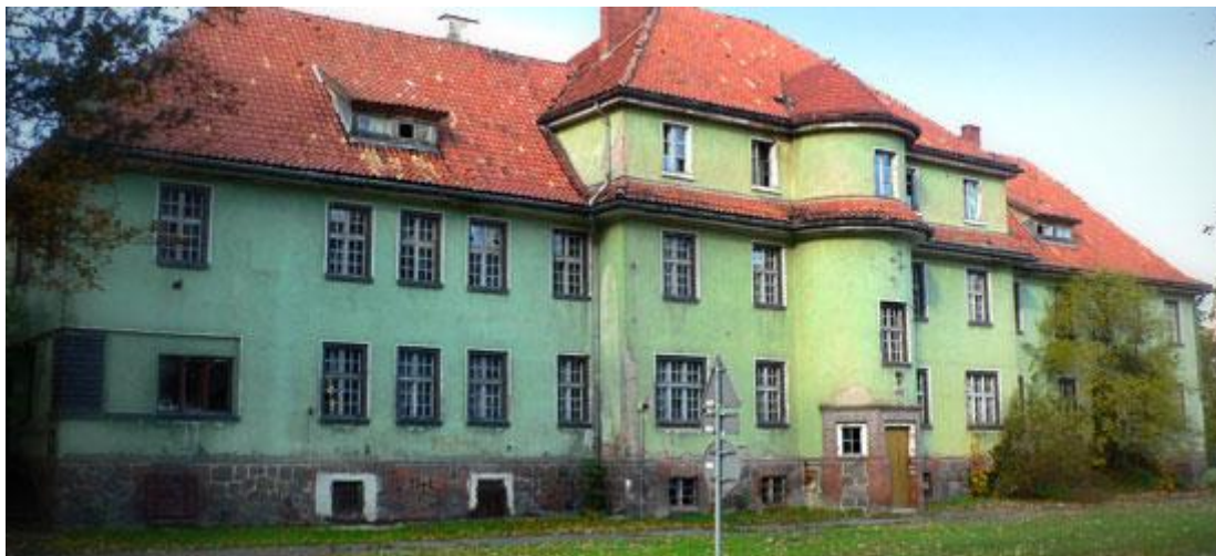
Zdjęcie: Budynek dawnego internatu „Kościuszkowiec”