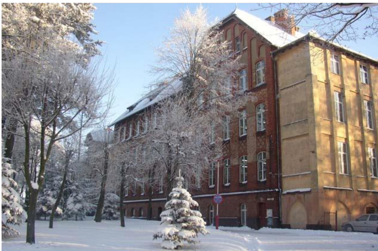
Zdjęcie: szkoła ZS CKR w Karolewie