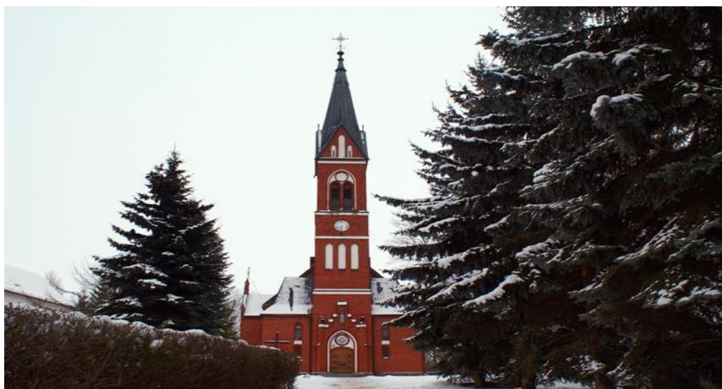
Zdjęcie: Kościół p.w. św. Stanisława Kostki w Karolewie