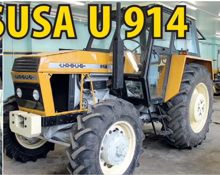
Etapy prac remontowych