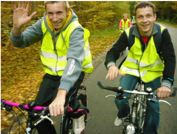
... do Gierłóży...