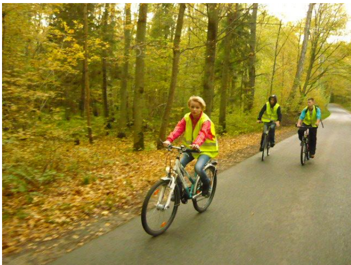
...przez bagna i lasy...