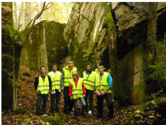
...i bunkry w „Wilczym Szańcu”.